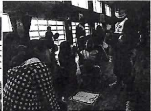
1年生とあいさつと握手後サインを書いたら1年生から手作り名刺をいただきました