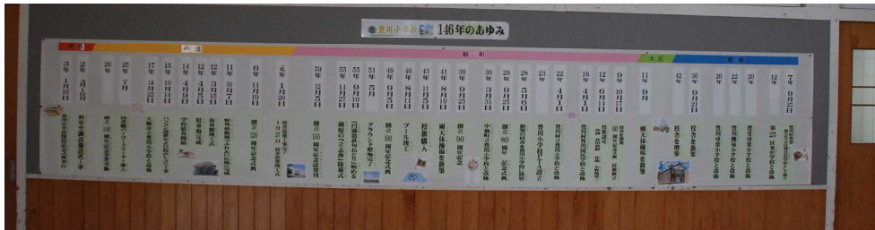
【「146年のあゆみ」を第一ホールに掲示しています】