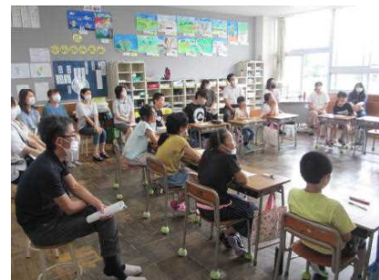
4・5年生 学級会 「スポーツ大会をしよう」