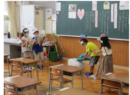
1年生 国語 「大きなかぶ」