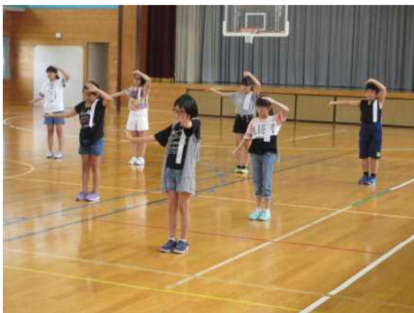
【円満造甚句踊り練習①】