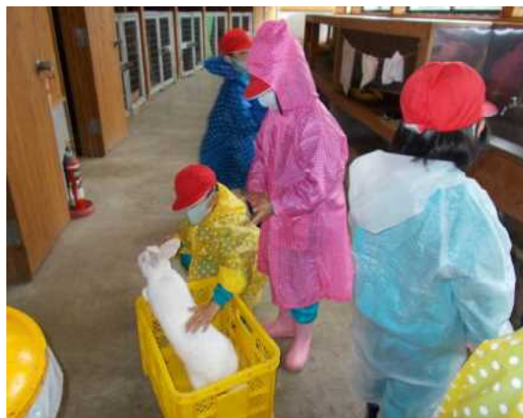
【1・2年生フィールドワーク】