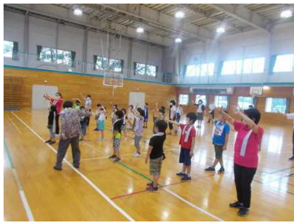
【円満造甚句踊り練習②】