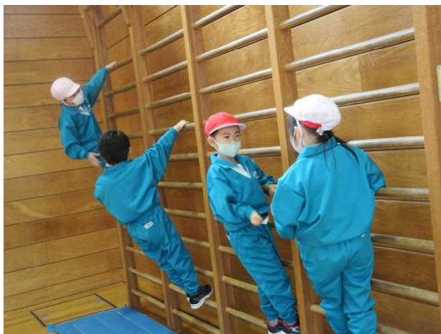
【1・2年生合同で体育】