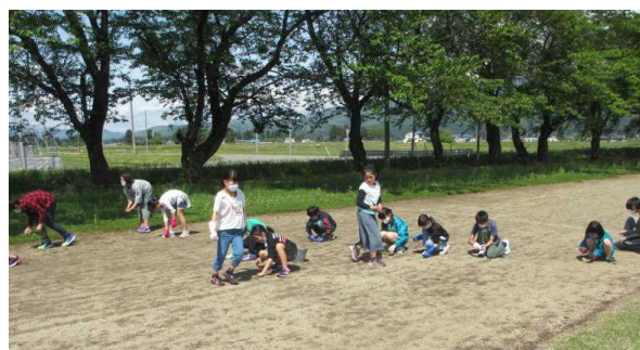
【全校グラウンド清掃】