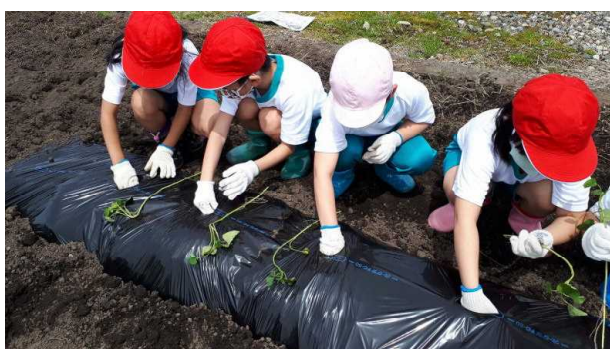
【さつまいも苗植え】