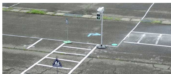
【交通安全教室 特設コース】