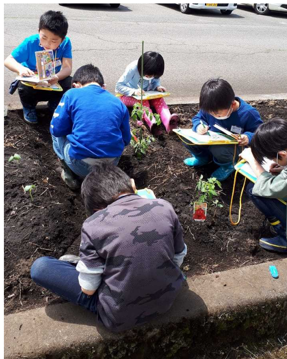
【2年生の生活科観察】