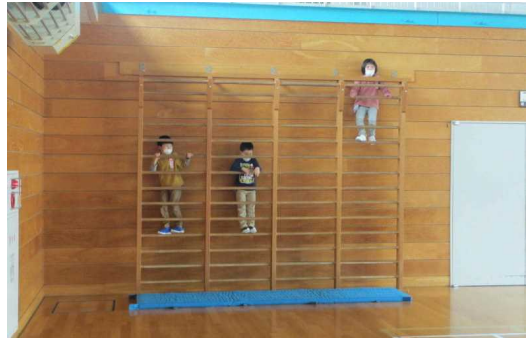
【休み時間 体育館の肋木で】

段階的なスタートということで、今日と明日は、全校が午後2時に放課となり、来週から時間割通りに進めていきます。また「『密接、密閉、密集』が重ならない配慮」、「手洗いの励行」、「使用頻度が高い箇所の消毒」等もして参ります。