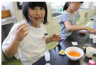
実験クラブ ゼラチンで固めて「プニプニ石けん」