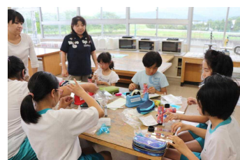
手作り・家庭クラブ オリジナル「万華鏡作り」