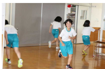
スポーツアウトドアクラブ 特別ルール「かくれんぼ」

異年齢の子ども同士で協力し、共通の興味・関心を追求しながら、様々な資質・能力を身につけていきます。