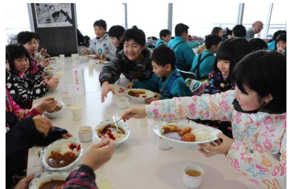
【お昼も楽しく、おいしくいただきました】