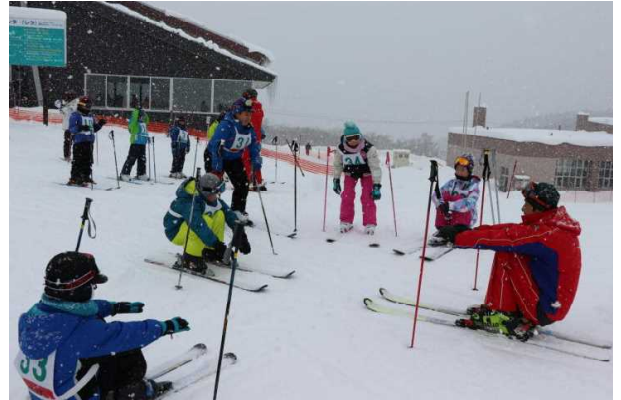
【準備運動はしっかりと…】