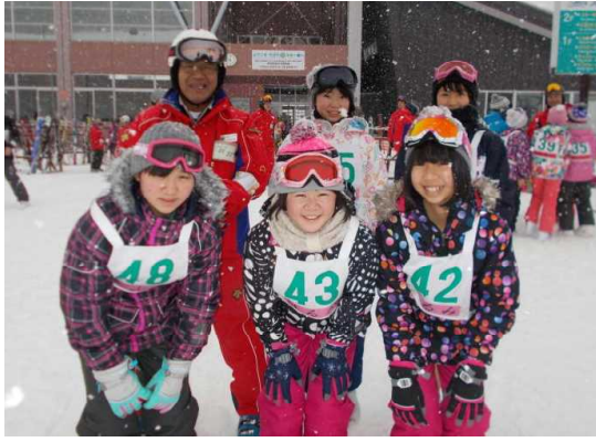
【グループごとの記念写真は笑顔で…】