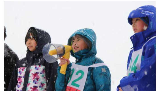
【上手に曲がれるようになりました。楽しいスキー教室でした。ありがとうございました。】