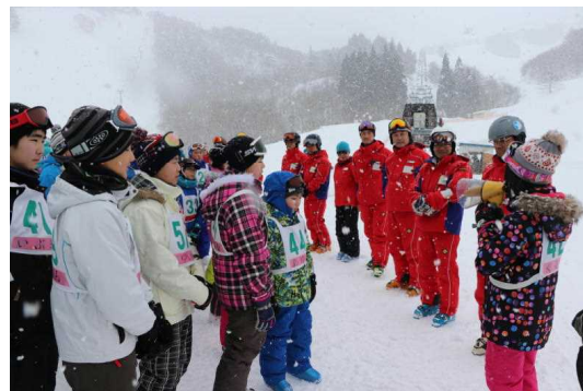
【始めの会 よろしくお祈りします】

大会でのプレーが評価され、秋田県バスケットボール協会から優秀選手に選ばれました。おめでとうございます。ますますの活躍を期待しています。