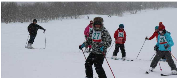
【その調子、上手だぞ…】