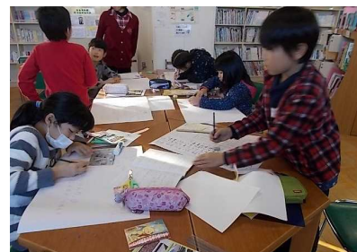
【学校に戻ってさっそく新聞に】