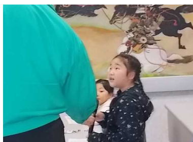
【質問ですが、・・・】