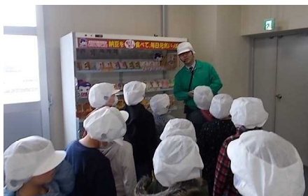
【説明を受ける子どもたち】

学習する内容は、地域には生産に関する仕事があり、自分たちの生活を支えていること。工場の仕事の特徴、他地域等とのかかわり等について調べ、それらの仕事に携わっている人々の工夫を考えるようにすることなどです。おはよう納豆は子どもたちにもなじみの品物ではありますが、会社の大きさや施設設備、製品へのこだわりなどについて、ガイドさんから説明を受け、驚きがいっぱいの見学となったようです。身近な一流企業に学ぶ、とてもよい機会となりました。