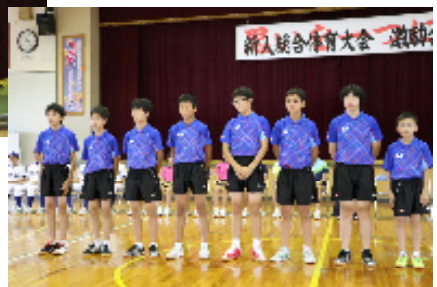
（新人戦激励会のようすから）