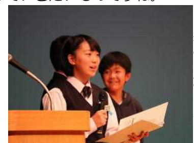
質問コーナーの司会を務める心雪さん