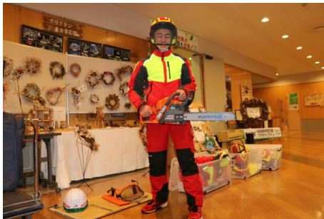
伐採作業着に変身