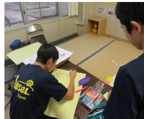
イモ販売ポスター作成