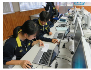
実行委員会全体計画