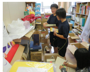
チャリティバザー品仕分け