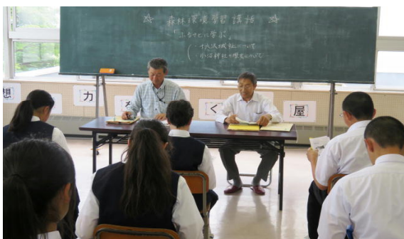
講師：十六沢城址緑地公園を守る会

*今年は熊の出没が相次いでいますので、山への散策等は行わない計画を進めていますのでご安心下さい。