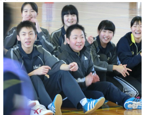
応援団もいい顔してます

昨日、校内球技大会が開催されました。大会が始まる前には「先生、絶対勝ちましょうね!」試合の合間には「さっきの試合どうでした?」笑顔、歓声、そしてちょっぴり悔しさも。いろいろな表情が溢れた楽しい時間でした。給食中もいつも以上に会話が弾み、後片付けも手際よく済ませ、次の試合に備えようとしていました。何に対しても手を抜かず一生懸命に取り組む人たちだなあと改めて感心しました。一つ一つの行事に“中学校生活最後”という冠が付きまします。子どもたちは「みんなとの楽しい思い出を増やしたい」「絆をさらに深めるきっかけに」などという思いで、今回のような行事はもちろん、何気ない一瞬一瞬も大事に過ごそうとしています。私たち学年部職員もこの子たち14名との1日1日を大切にしていかなければならないな、という思いをさらに強くした1日でした。