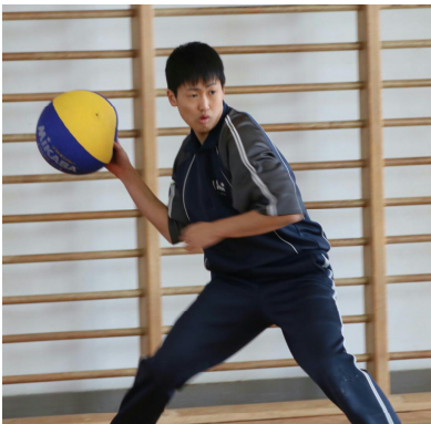
雅史さん渾身の一投