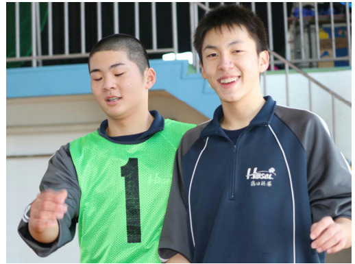
勝利の後のさわやかな笑顔