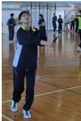
奏さんスーパーショット