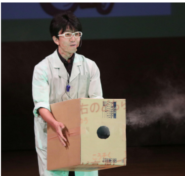
おもしろ実験がたくさん