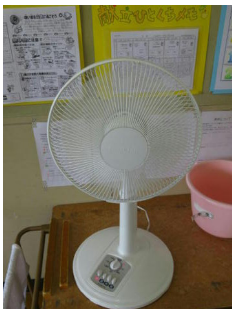
これも大活躍です。