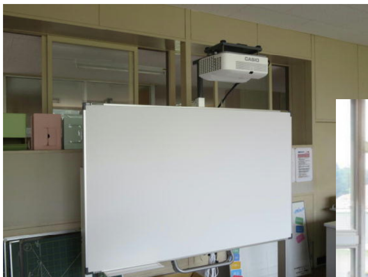
インターネットにも無線で繋がる 電子黒板 2台あります。