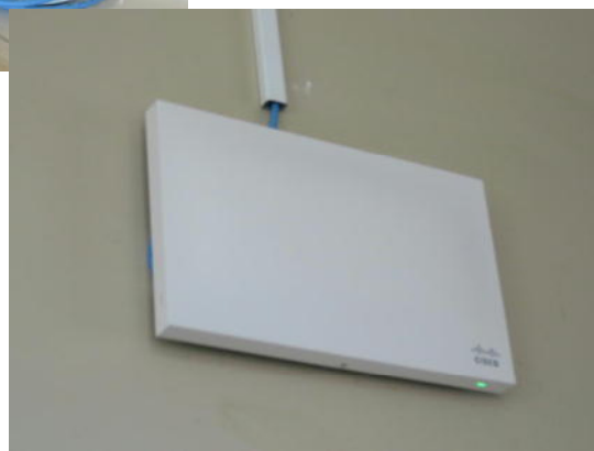
電子黒板やタブレット型パソコンはこの無線 LAN で繋がっていて学校の中で場所を選ばず、自由に移動して使うことができます。