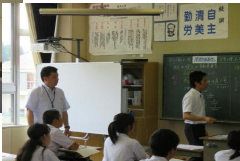
教室でも使っています。