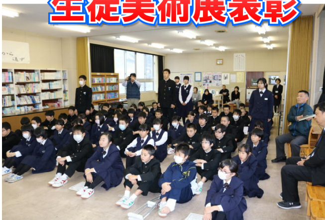
表彰の様子 計6名 受賞