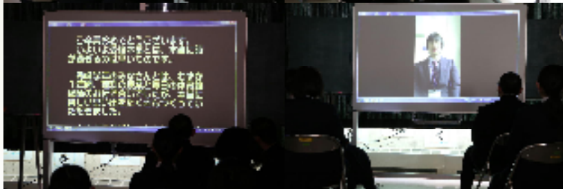
お世話になった先生方からのメッセージ