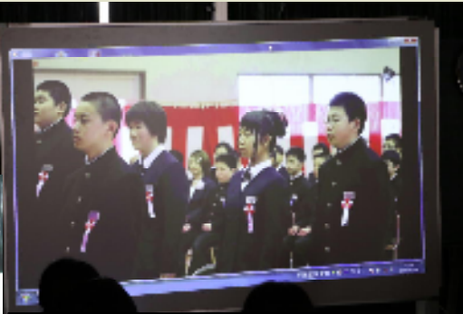
懐かしの ムービー上映