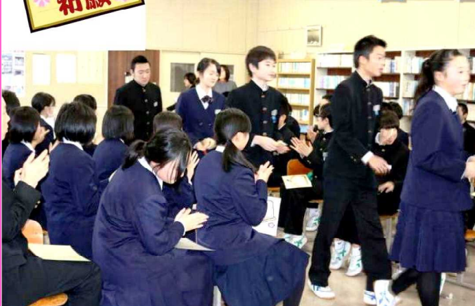
絵馬をもって入場しました!