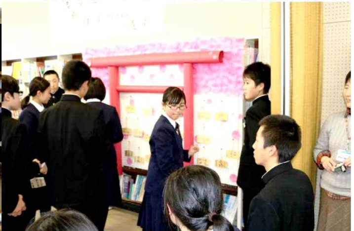
〈躍進神社〉に絵馬を奉納