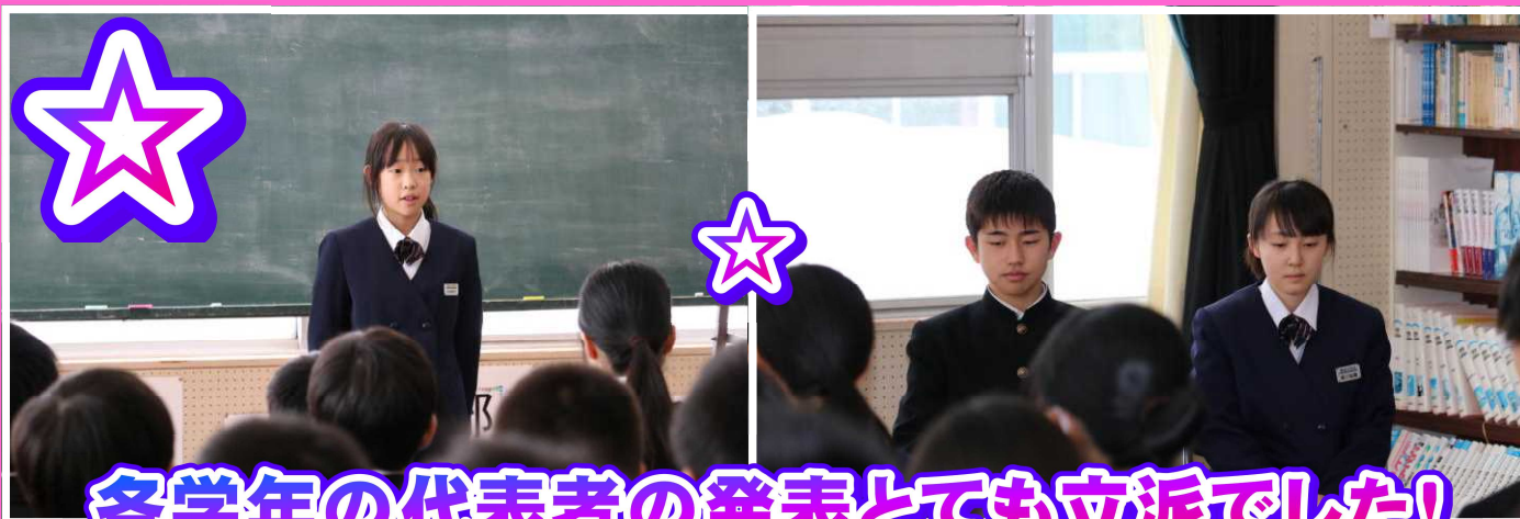
各学年の代表者の発表とても立派でした!