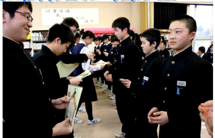
後輩からメッセージカードを贈られて☆