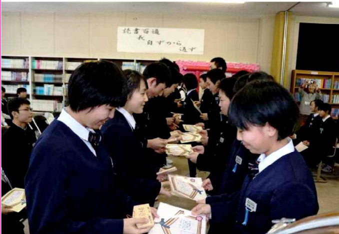
「先輩、がんばってください。」