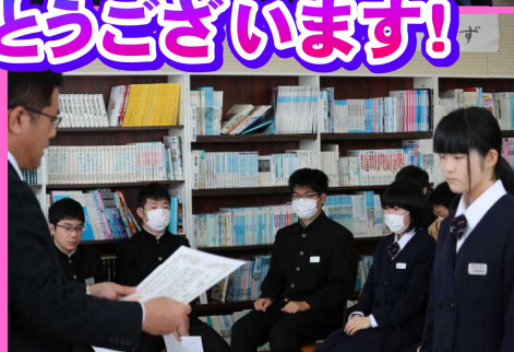
☆ おめでとうございます!