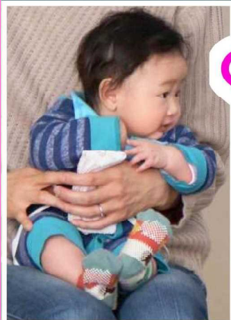
まだ生後四ヶ月でちゅよ