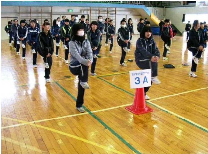
準備体操もばっちり!