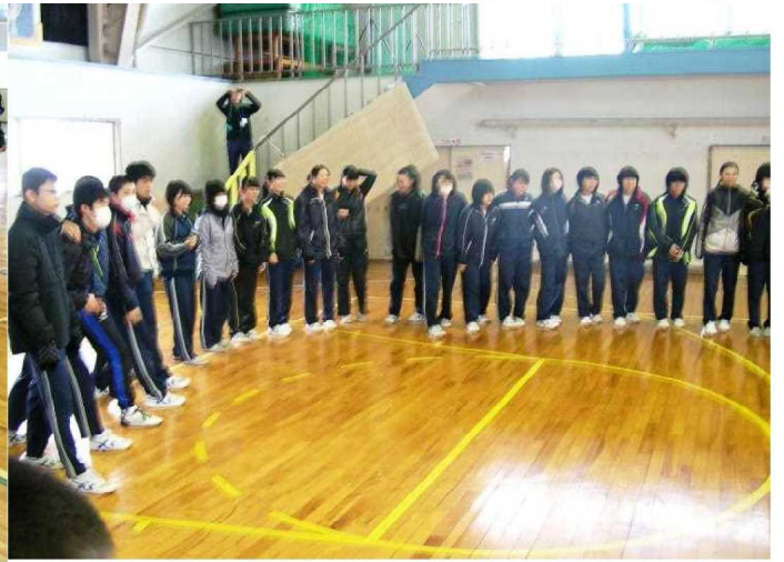
円陣で気合いが入りました!