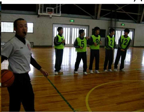
バスケも燃えました!

体を動かす機会がめっきり少なくなっている3年生ですが、最後の校内球技大会では伸び伸びとプレーし、楽しむことができたようです。さわやかな汗をかき、クラス一一致団結してがんばり、みんな笑顔がこぼれていました。