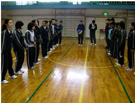
ドッチ 延長戦突入