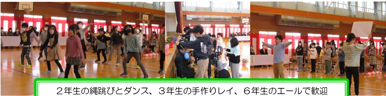
2年生の縄跳びとダンス、3年生の手作りレイ、6年生のエールで歓迎