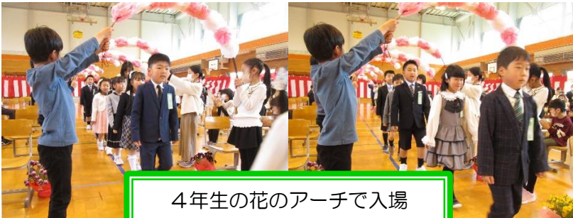
4年生の花のアーチで入場

校長の式辞では、全校児童の目標である「なかよく」「かしこく」「すこやかに」を実現できるように、心がけて生活してほしい点を伝えました。一日も早く小学校の生活に慣れて、一人で、そしてみんなのできることをどんどん増やしてほしいと思います。