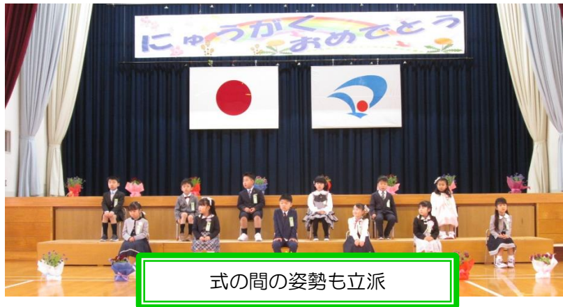
式の間姿勢も立派