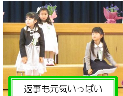
返事も元気いっぱい