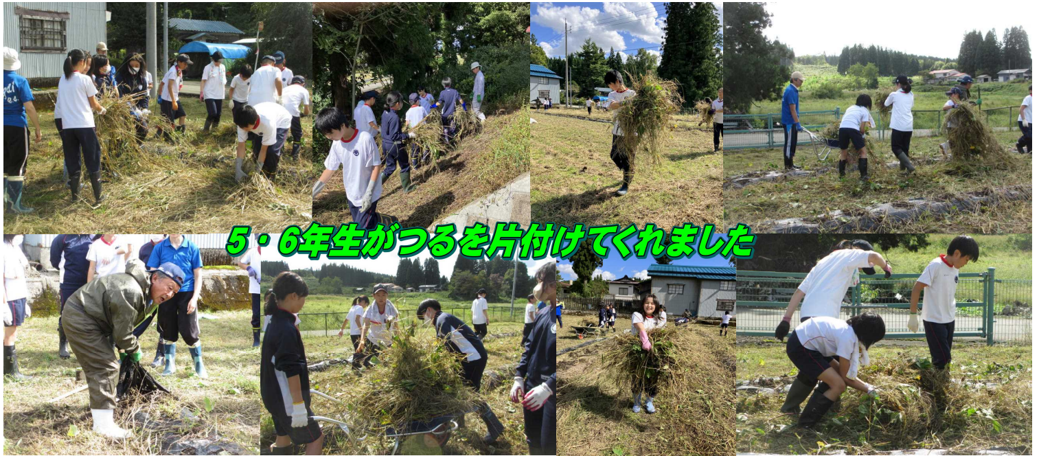
5・6年生がつるを片付けてくれました