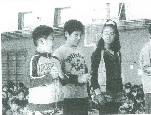
〈全校集会で、全校の前で発表する子どもたち〉

大事にされ、子どもたちの発表で学習が進んだり深まったりすることが必要です。授業中に積極的に発表することができる子どもの育成は本校の重要な課題ととらえています。そこで本校では、全校集会や行事の折りに、300人の前で発表をする訓練を続けています。題して「人前力(ひとまえりよく)の育成」。小規模校ではできない大勢の前での発表経験を積ませ、言語の力から声量の加減までを身に付けさせたいと考えています。