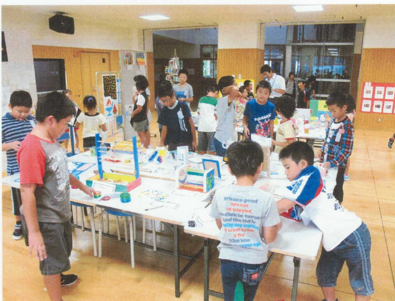
〈 作品を鑑賞する子どもたち 〉

本校では現在、「夏休み作品展」を開催中です。工作や手芸、絵、書、調査報告書や体験記など、どれも力作揃いで、私たち大人でも見応えのある作品ばかりです。中でも子どもたちに人気があるのは動きのあるオモチャ。手にとっては動かしてみたりゲームを楽しんだりしています。女の子は手芸作品にも興味があって、クッションやきれいな飾り付けの小物に見入っています。今年は県立近代美術館で「藤城清治の世界展」が開催されているせいでしょうか。切り絵作品も出品されました。