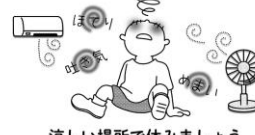
涼しい場所で休みましょう