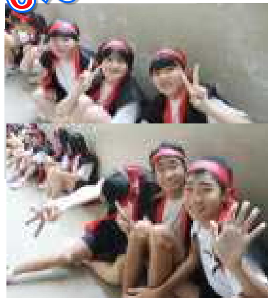
協中ソーランのスタンバイ風景 わくわくドキドキ待っていました。