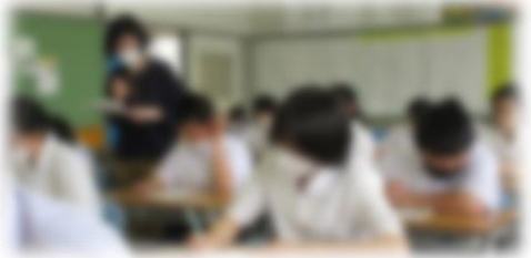
ちょっと緊張 〇〇さん