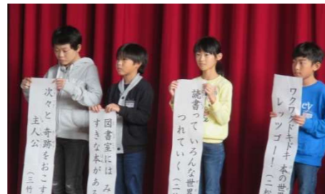
「読書標語」 花館小学校