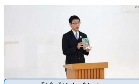
「ビブリオバトル」 西仙北中学校