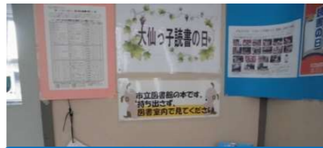
「ブックリストの展示」 協和中学校