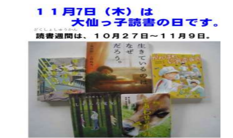
「ブックリスト紹介だより」 大川西根小学校