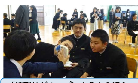
「縦割りグループによる本の紹介」 大曲南中学校