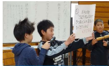
「本となかよし集会」 東大曲小学校