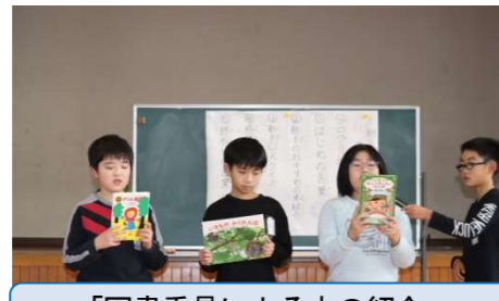
「図書委員による本の紹介」 太田南小学校