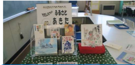
「おすすめの本のコーナー」 平和中学校