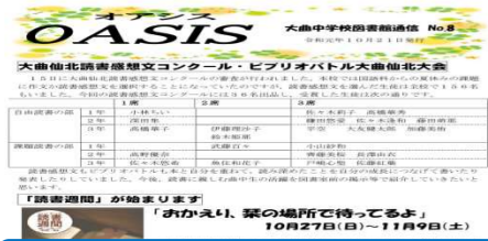
「図書館通信」 大曲中学校