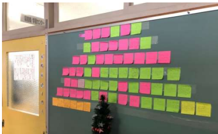
「ブックツリー」 仙北中学校