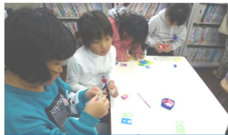
「マイ しおりづくり」 中仙小学校