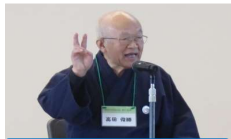
「読書集会 昔語り」 大曲小学校

図書委員会の子どもたちや教職員、大仙市立図書館の読書サポーターや地域のボランティアの方々による「読み聞かせ」、「読書集会」が多くの学校で行われました。