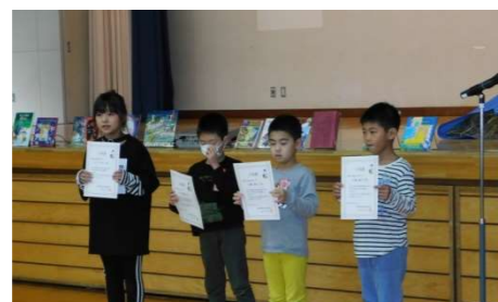
「まるびちゃん読書通帳 表彰」 清水小学校