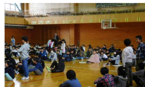
「図書室利用 表彰」 西仙北小学校