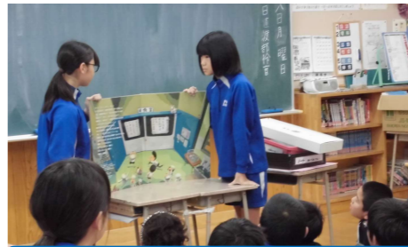
「図書委員による読み聞かせ」 四ツ屋小学校