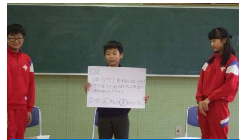
「読書集会・読書クイズ」 角間川小学校