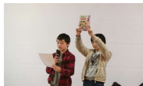
「おすすめの本の紹介」 協和小学校