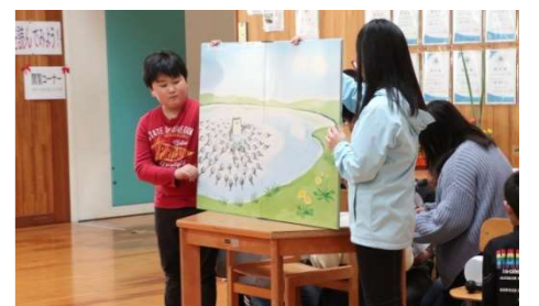
「大型絵本読み聞かせ」 横堀小学校