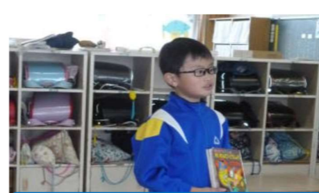
「ビブリオバトル」 藤木小学校