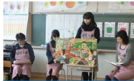
「図書ボランティアによる読み聞かせ」 内小友小学校