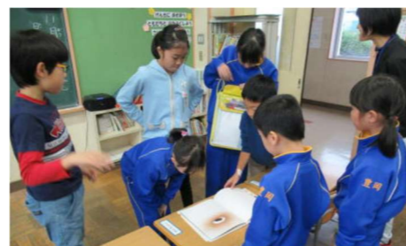
「読書クイズラリー」 豊岡小学校