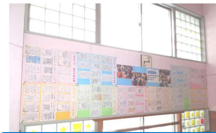
「しおりのプレゼント」 神岡小学校