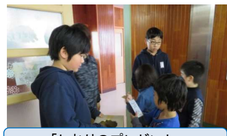
「しおりのプレゼント」 太田東小学校