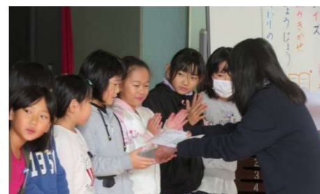
「多読賞 表彰」 高梨小学校