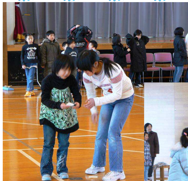
ゲーム かりものきょうそう じんとりゲーム