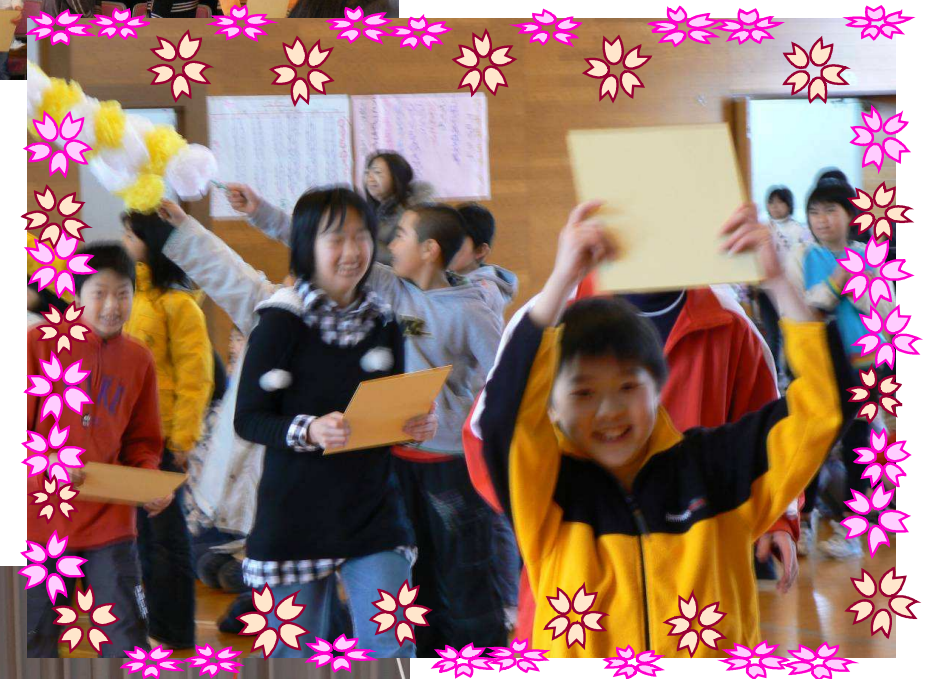
6年生からの発表。 劇や演奏をよりました。