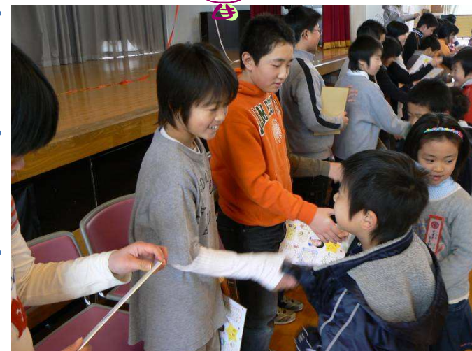
お世話になった6年生へ感謝の気持ちをこめて色紙のプレゼント