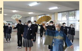
<能楽師を招いた音楽の授業>