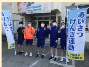
<あいさつ元気運動>