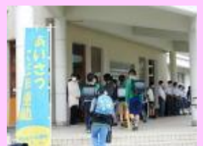
<あいさつこだま運動>