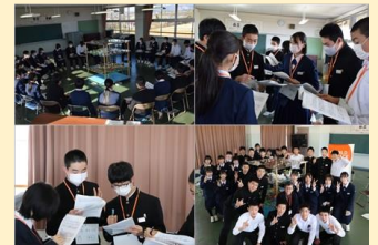
<ワールド・ピース・ゲーム>