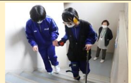
<障がい者理解体験>