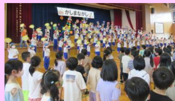
<鹿島流し出で立ちの式>