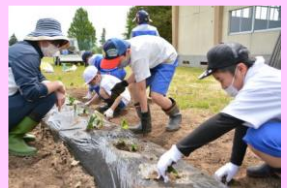
<サツマイモの苗植え>