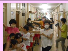
<盆踊り・お囃子教室>