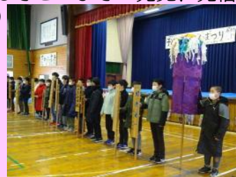
<こどもぼんでん祭り>