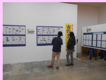
<古四王学習の商業施設での展示>