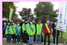
<仙北地域あいさつ運動>