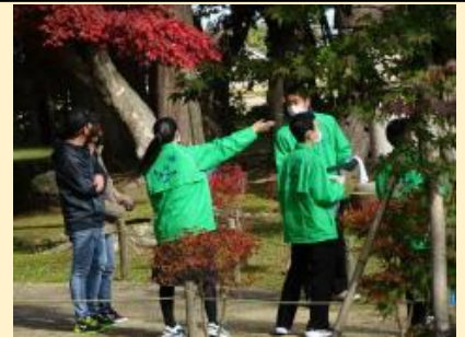
<旧池田氏庭園観光ガイド ボランティア>