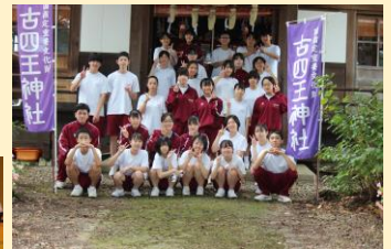
<古四王神社の清掃>