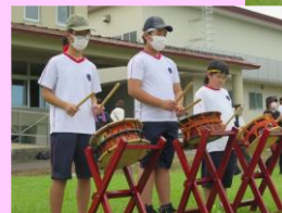
<南外小唄の演奏と踊り>