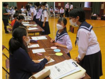
<生徒会・児童会交流会>