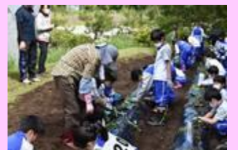
<農業の達人とともに畑作業>