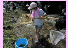
<河川上流での水質調査>