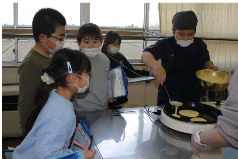
「メリークリスマス」