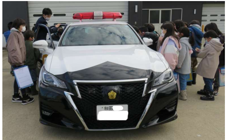
「3年フィールドワーク：大仙警察署」 パトカーに乗車させていただきました