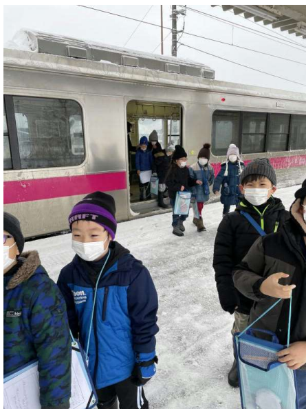
「2年フィールドワーク：大曲駅～神宮寺駅」 乗車券を購入して一駅列車の旅を体験しました