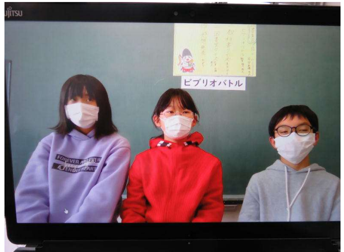
タブレット画像：ビブリオバトル