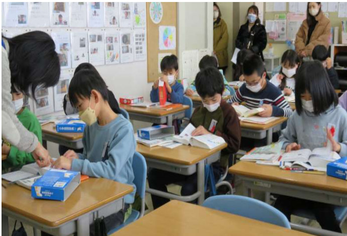
↑ 3松「国語：漢字の意味」