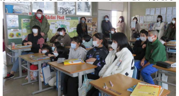
↑ 6松「社会：町人文化と新しい学問」