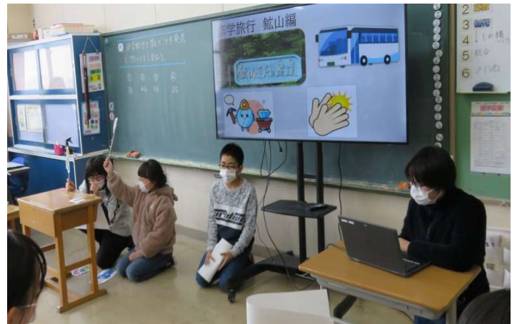
↑ 6竹「総合的な学習の時間：ふるさと秋田再発見！」