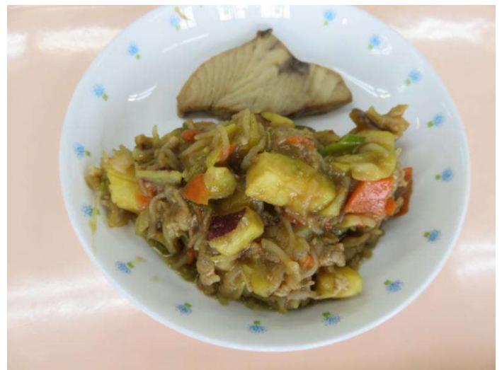
↑下が「旬のさつまいもと豚肉のおいしい炒め」↑