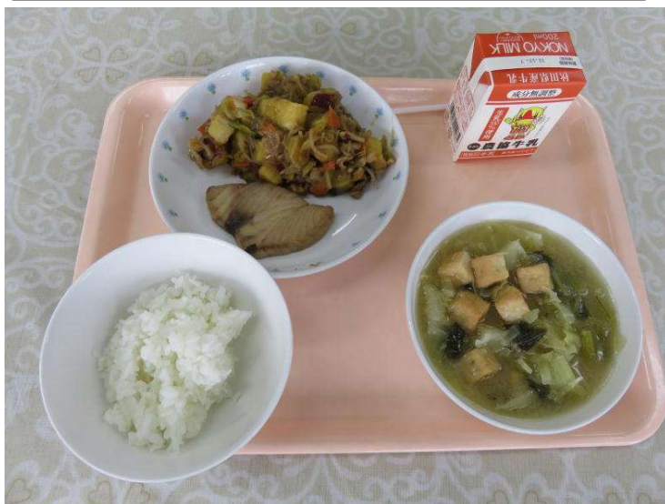
↑30日の給食です「お米はサキホコレでした」↑