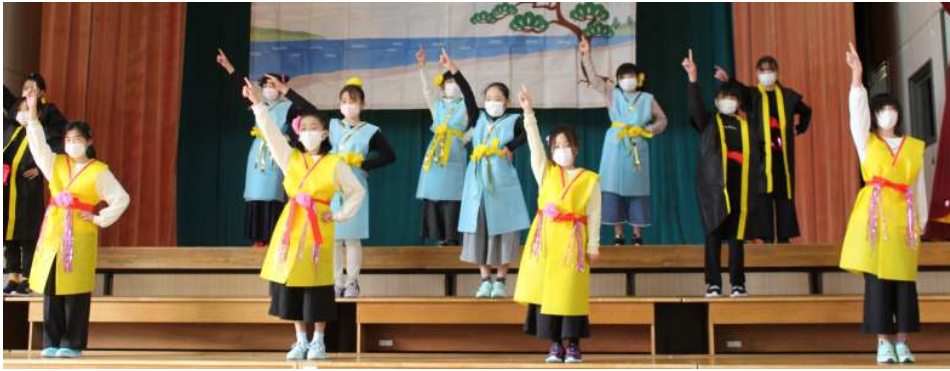
←4年「うらしま兄弟物語」