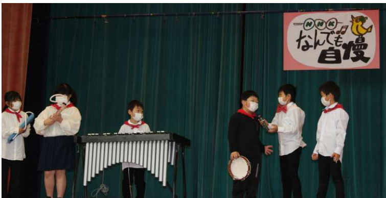
↑ 2年「N・H・K何でもじまん」