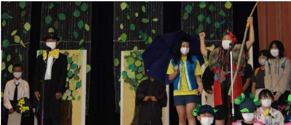
←6年 「ユウタと不思議な仲間たち」 ↓「はあと学年全員集合」