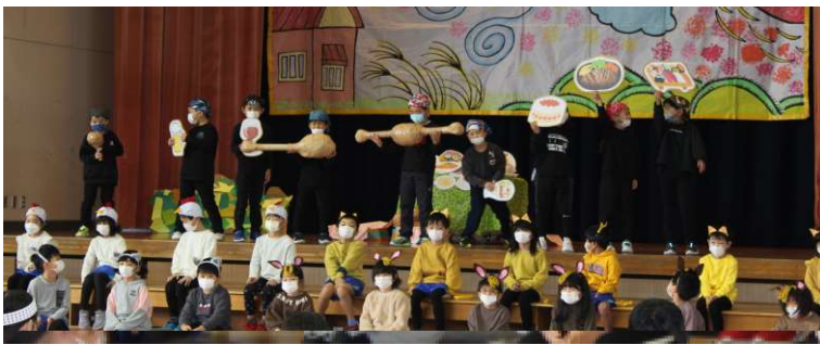
↑ 1年「ブレーメンの音楽隊」

子どもたち一人一人の頑張りを認め、今後の教育活動につなげていけるよう職員一同で取り組んでまいります。これからもご協力、ご支援をよろしくお願いいたします。