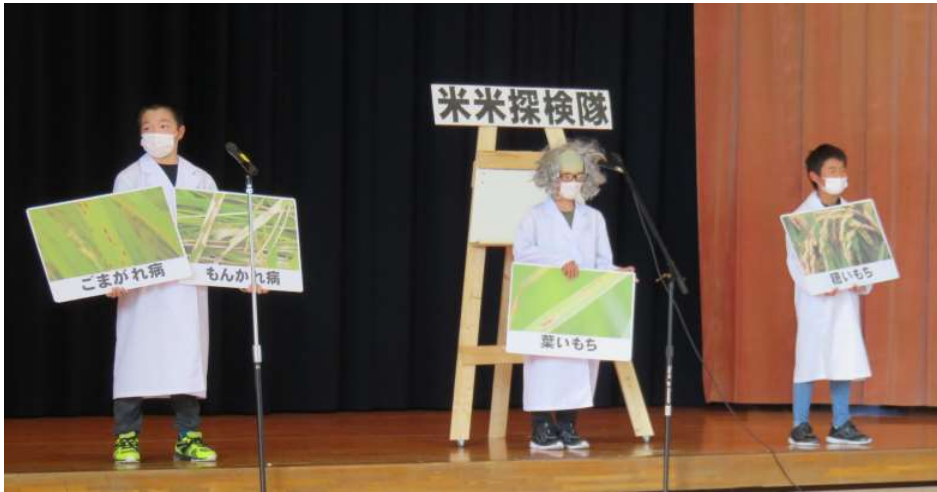
←5年「ひだまり米米探検隊」