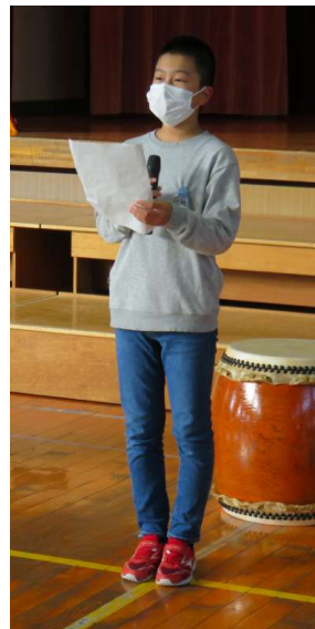
↑ 「はじめのあいさつ」 6松：森元〇〇