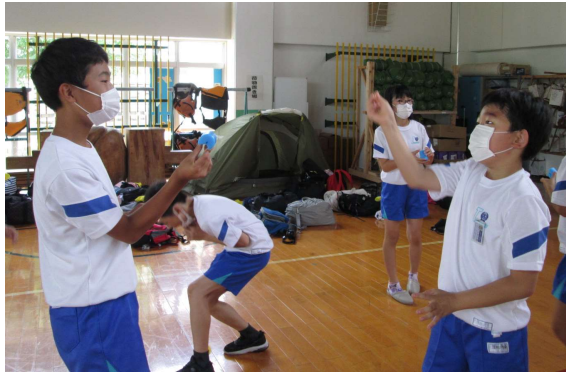
プロジェクトアドベンチャー