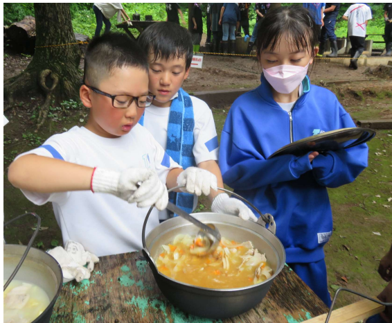
野外炊飯（カレー作り）