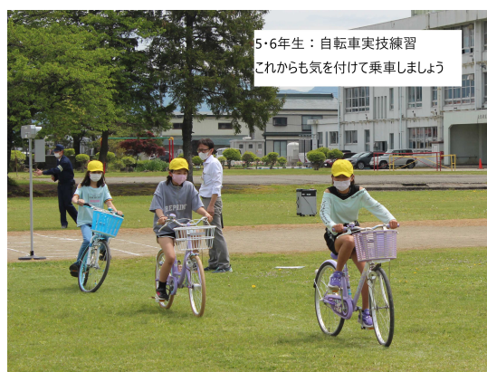
5・6年生：自転車実技練習 これからも気を付けて乗車しましょう