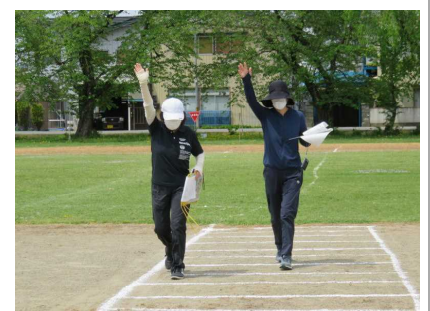
先生たちの師範もとても上手でした