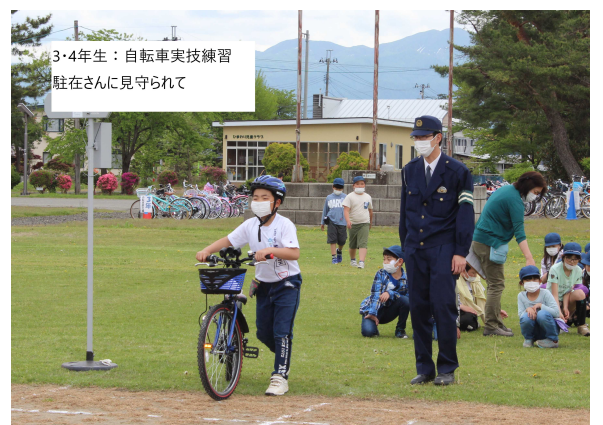
3・4年生：自転車実技練習 駐在さんに見守られて