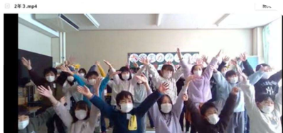
各学年から6年生の皆さんへのメッセージ (写真はPC画面より =スクリーンショット=)