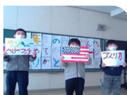
いろいろな国の言葉で「ありがとう」