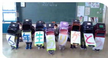
おしぎをしたら、せおついたランドセルのふたが開いて…

一堂に会しての集会ではありませんでしたが、とても温かさが伝わり、また感動がこみ上げてくる素敵な集会になりました。