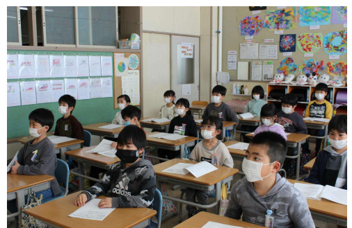
教室で、真剣に資料に目をおし、話を聞く子どもたち

※今回は直接の意見交換や話し合いができませんでした。会の中で運営委員会から、「みんなが、もっと気持ちよく生活できるようにできることを、学級で話し合いそれを伝えてほしい。」と呼びかけがありました。なんと、早速1・2年生から、運営委員会に声が届けられたそうです。