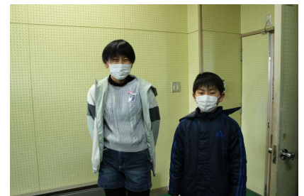
引き継ぎを終えて・・・