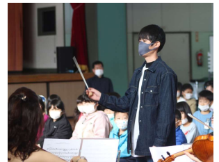
↑ 楽器紹介 指揮者体験 →