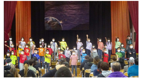
5年生「みんなの未来へ向かって！～COSMOS～」