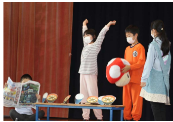
3年生「たいよう放送局によるしっただげたまげだ秋田井！」