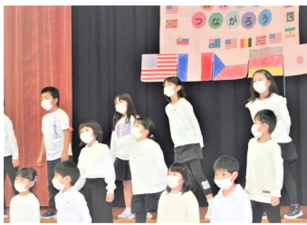
2年生「音楽でみんなとつながろう」