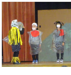
1年生 劇「こもれび かさこじぞう」