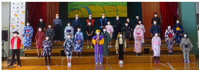
↑ 体育館での演技 ↓