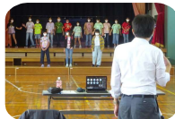
体育館で撮影・配信