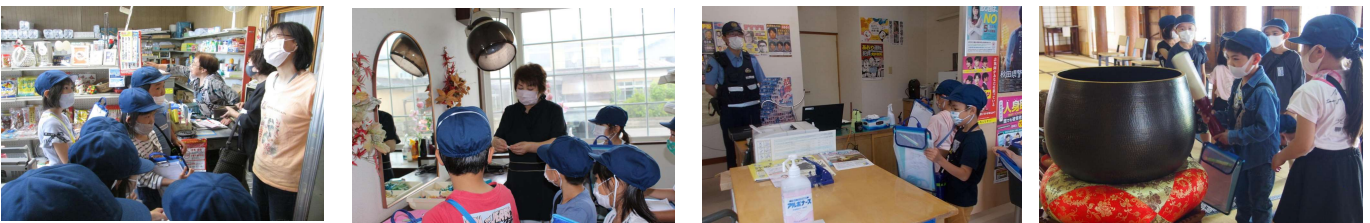
後藤商店コースの子どもたち

「生活科」の学習として、4つのグループに分かれ、それぞれ目的の場所を訪れました。自分たちの住む町で働く人たちに関心を持ち、進んで関わることをねらいとした学習でした。子どもたちは、それぞれの訪問先で、積極的にインタビューをし、「おしごとのようす」や「はたらく人のおもい」などについて学びを深めました。