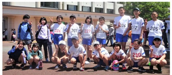
【陸上競技大会に出場した皆さん】

みんな、堂々と競技していました。すばらしかったです。がんばりましたね。おめでとう。