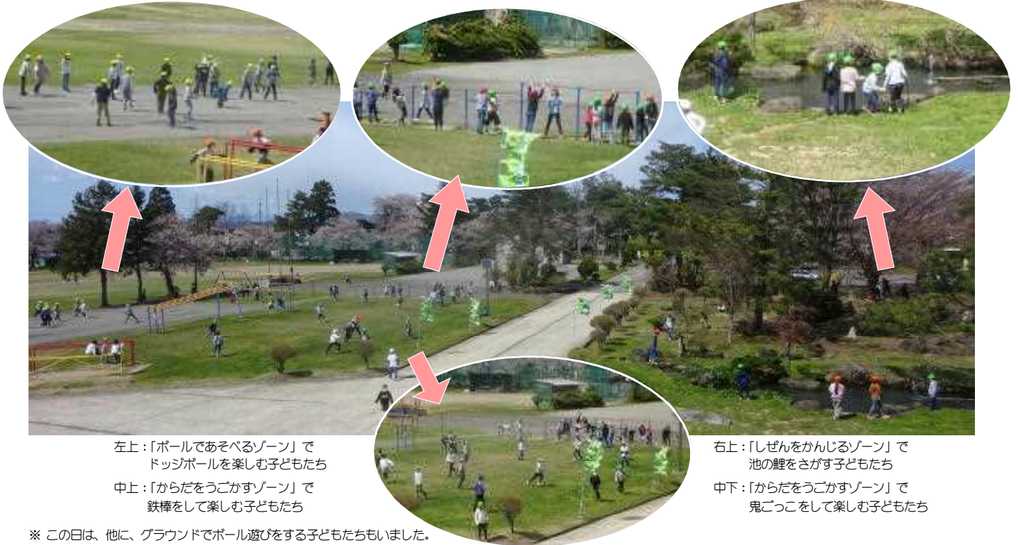
左上：「ボールであそべるゾーン」でドッジボールを楽しむ子どもたち

おとといは青空がのぞくよいお天気でした。長休み（のびのびタイムⅠ、のびのびタイムⅡ）には、たくさんのお子どもたちが外で元気に遊ぶ姿が見られました。高梨小学校は、周囲の景色にも、校地にも恵まれた学校です。