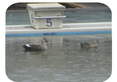
カモの親子(?)～プールで遊泳～