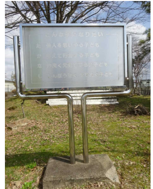
前庭に建つ「めざす子ども像」プレート

本校では、校訓「尚志」「知新」とともに、この「めざす子ども像」を継承し、お子さん一人一人を大事に育てていきたいと思っております。