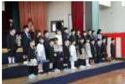
一人一人、はっきりお返事できました