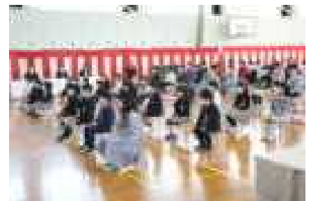
お行儀よく座って、式に参加しました