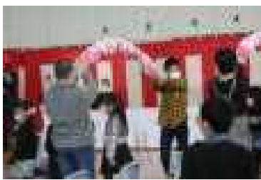
花のアーチをくぐって入場