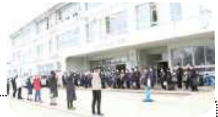
5年生からのエール