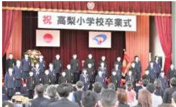
呼びかけ「巣立ちの詩」