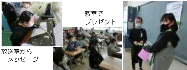
教室で プレゼント

6年生のみなさんに感謝の気持ちを伝える集会が行われました。5年生が企画・運営し行いました。新型コロナの影響で、放送を使っただけの集会となりましたが、6年生への感謝の思いや6年生のみなさんからの温かい思いが伝わる会になりました。